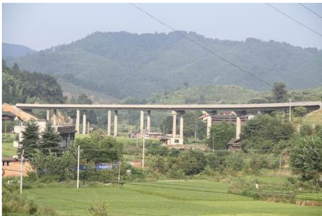
绥宁至乐安包茂高速公路连接线枫香高架桥，